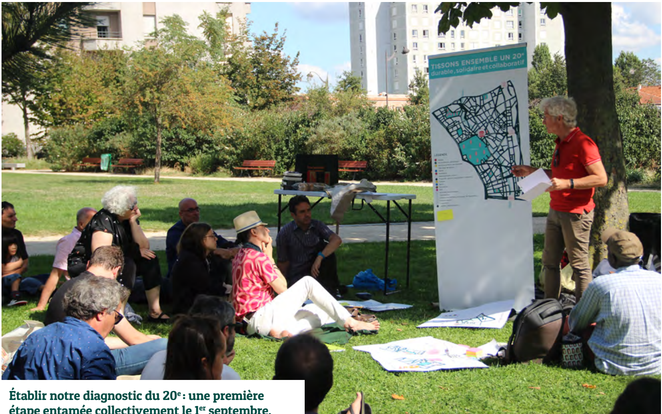
Établir notre diagnostic du 20 e : une première étape entamée collectivement le 1 er septembre.