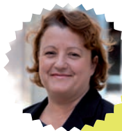
Frédérique Calandra Maire du 20 e arrondissement